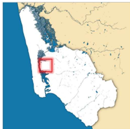
Plan cadastral Surface Zonage