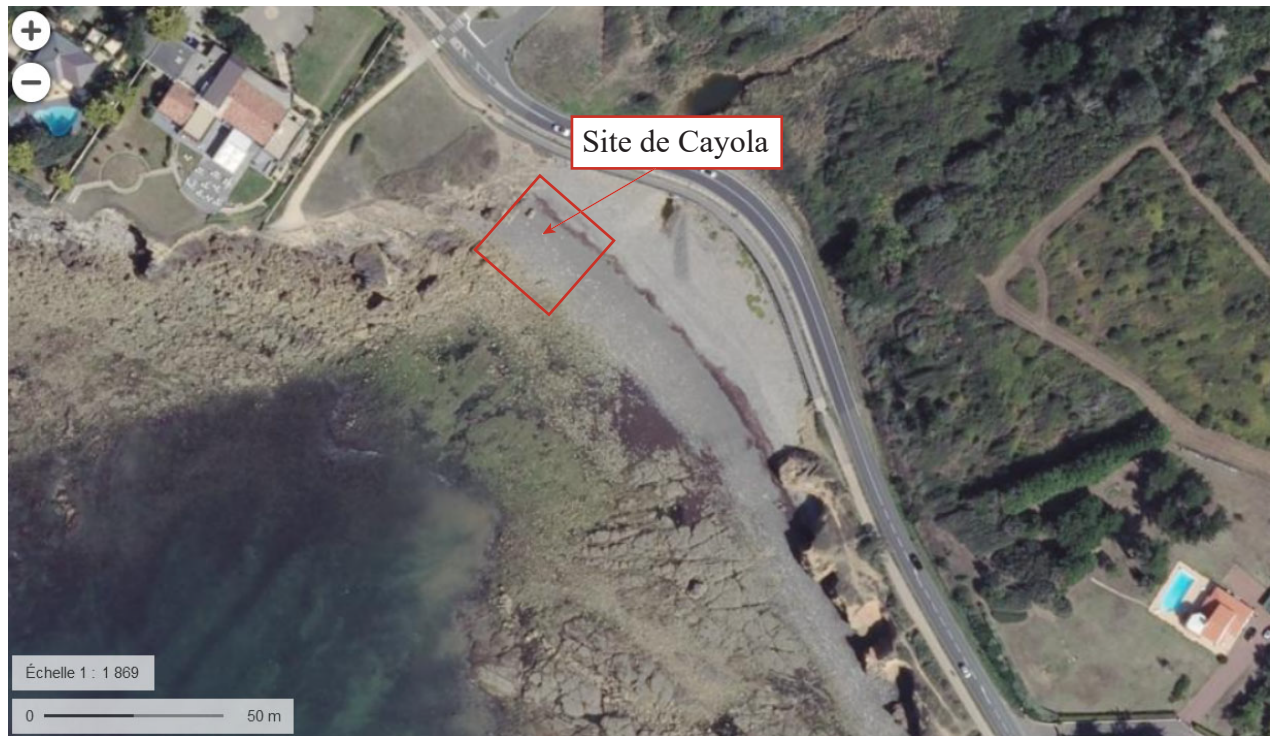
Figure 3 : Fenêtre de fouille projetée